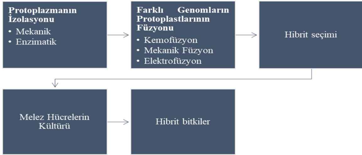
Figure 2. Schematic representation of hybrid plant production by protoplast fusion technique (Hussain et al., 2012).